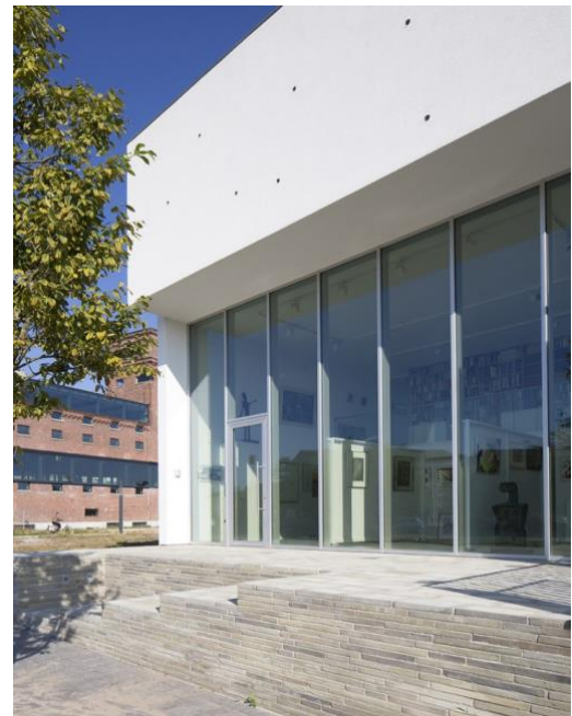
Bert Kuipers Kunsthandel