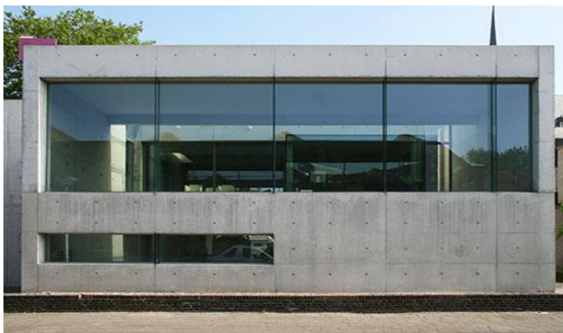
Van der Jeugd Architecten